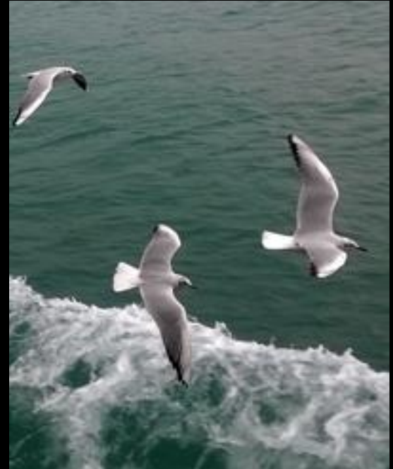
Dalga kovalayan martılar

KERKENEZ Ücretsizdir, telif ödemez. Katkı koyanlar bu koşulları kabul etmiş sayılır. Yazıların sorumluluğu yazarlarına aittir.