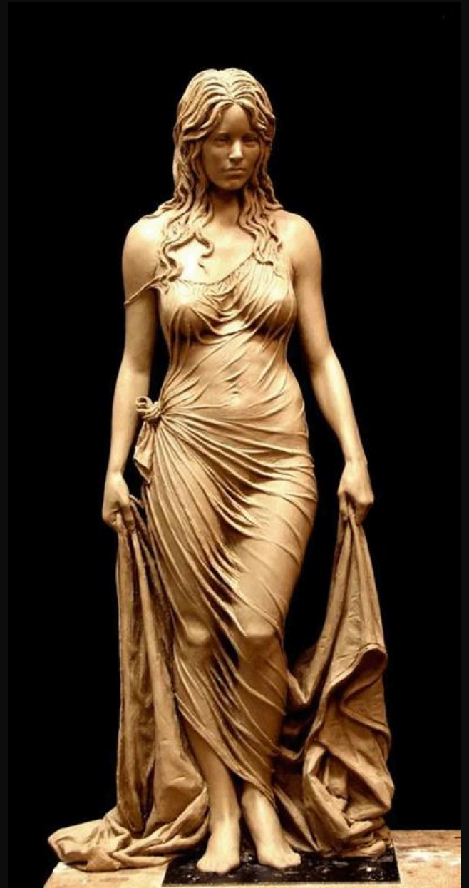
Bronz Bathsheba Heykeli Benjamin Victor